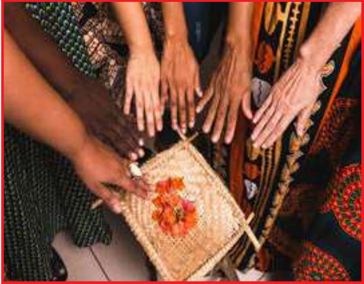
Evento gratuito é realizado pela Comissão de Jornalistas pela Igualdade Racial