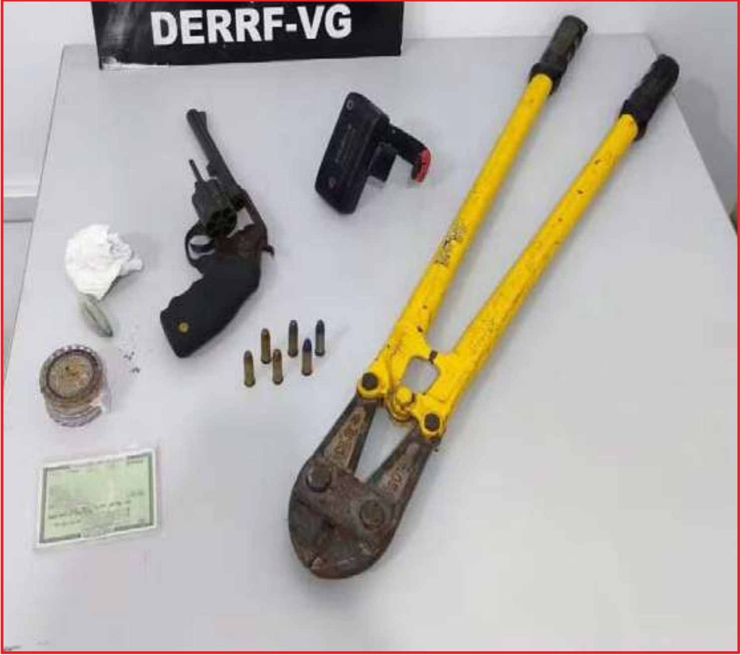
Foram apreendidos arma de fogo, munições, tornozeleira eletrônica e um documento falso

Uma associação criminosa que praticava roubos na zona rural dos municípios de Várzea Grande e Nossa Senhora do Livramento foi alvo da 2ª fase da Operação Agrum Tatum, deflagrada pela Delegacia Especializada de Roubos e Furtos (Derf), nesta semana. Durante a ação, foram cumpridos seis mandados, entre prisões e buscas. De acordo com a delegacia, as ordens judiciais foram cumpridas depois que